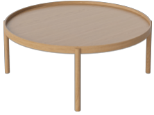
Tab Coffee Table Ø90, H34

Height 34 cm Diameter 90 cm Width 90 cm Tabletop thickness 4 cm Weight 11.50 kg Max weight capacity 30 kg Producer Aage Østergaard Møbelindustri A/S